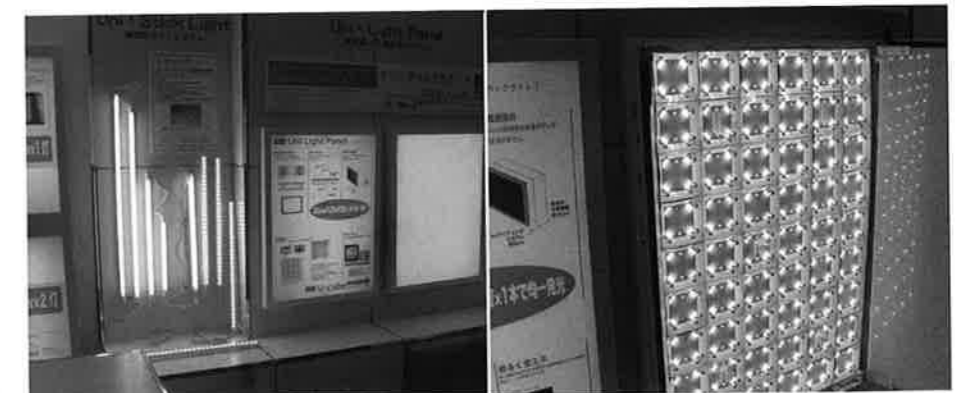
用途や予算によって蛍光管とLEDを使いかわける「esライティングシステム」や「ユニ・スティックライト」を提案した彩ユニオン