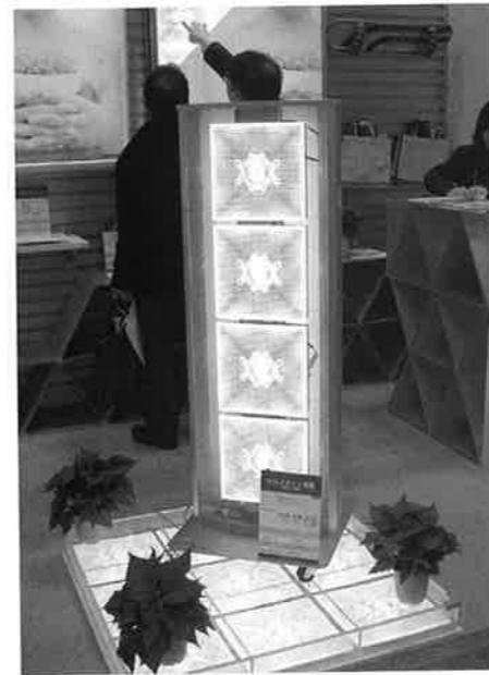
タテヤマアドバンスは、LEDバックライト式照明ユニット「アドバンスライト」を紹介した