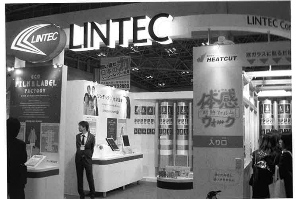
遮熱フィルムの効果を体験できるスペースを設けたリンテック