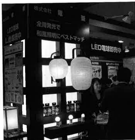
電菱はLED電球「L魂（えるだま）」等を紹介した

大学やNGO、NPOの出展ゾーンも設置された。また、企画展示やシンポジウム・セミナーなども開催された。来場者の年齢層は幅広く、3日間合計で182,510名が訪れた。主催は(社)産業環境管理協会、日本経済新聞社。