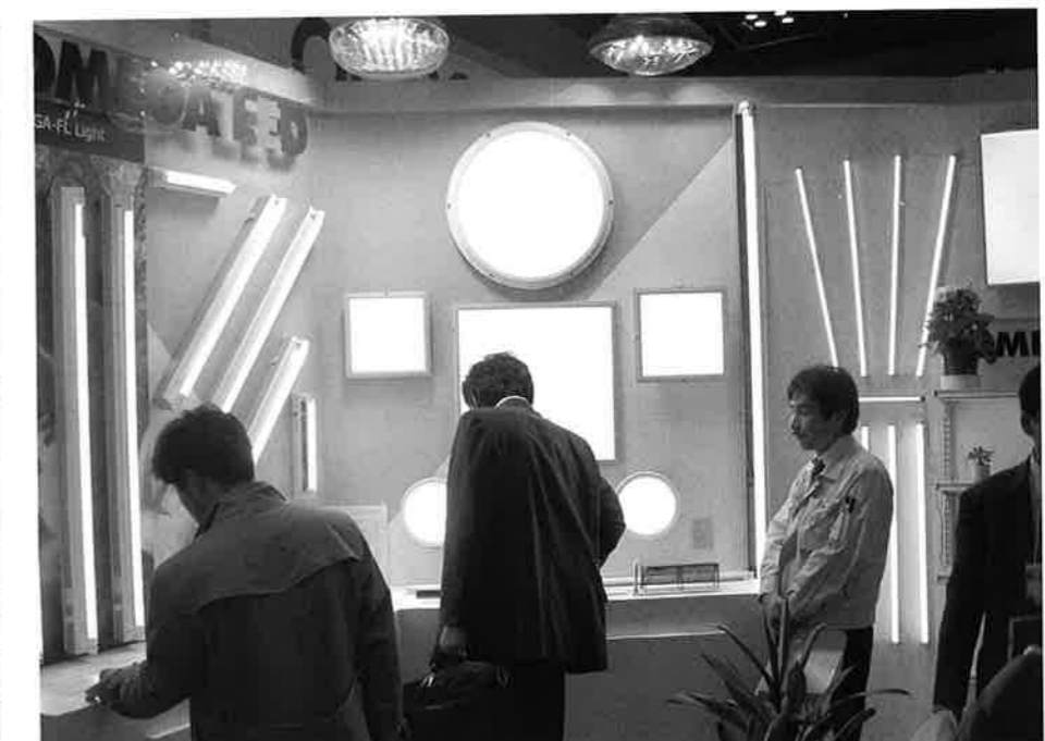
「OMEGA LED モジュール」を展示したEG1