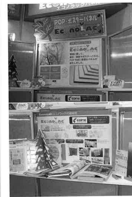
ベルアドワイズは環境対応型低発泡スチレンパネル「EconoLAC」を紹介した