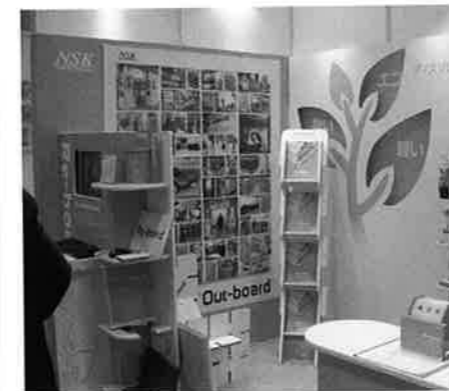
日本製図器工業はリサイクル可能なエコ資材「Re-board」を使ったディスプレイを提案した