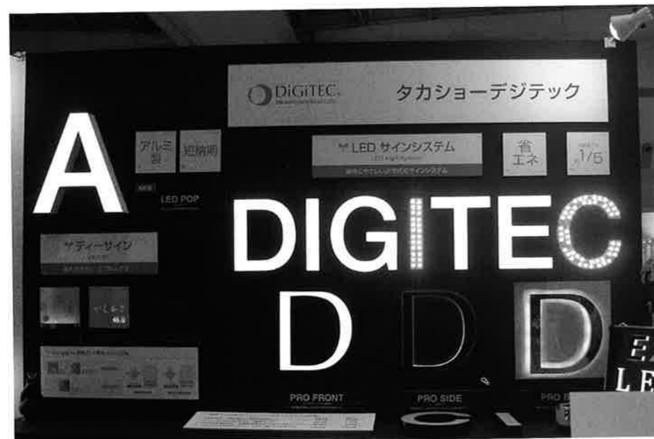
タカショーデジテックの「LED POP」はLED光源のチャンネル文字。同社の従来品よりも低価格で、これまでとは違う客層も販売対象としている