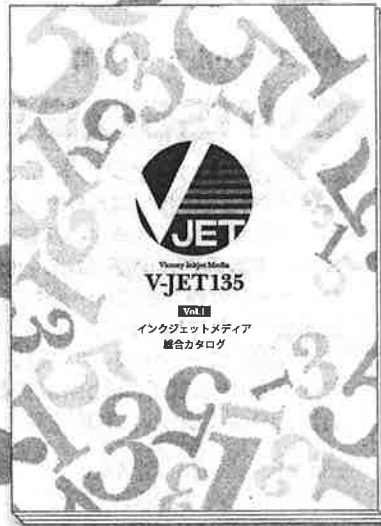
インクジェットメディア総合カタログ 「V-JET135 vol.1」