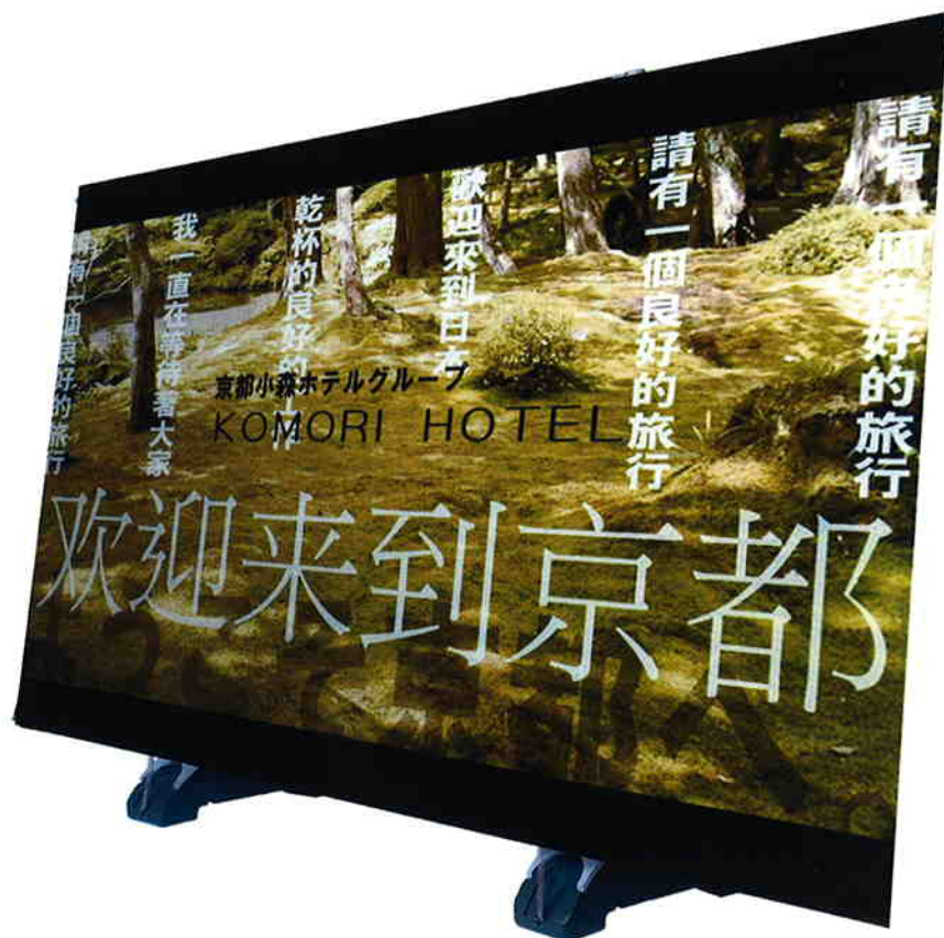
商品名：大型パナースタンド「アルファ・エス」 / スクリーンサイズ：2m×3m ／ 参考価格：198,000円