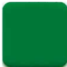
SS-G グリーンボード (チョーク用)