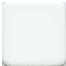
SS-008 ホワイトボード (マーカー用)