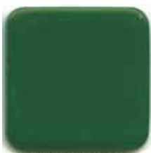
SS-GM グリーンボード (マーカー用)